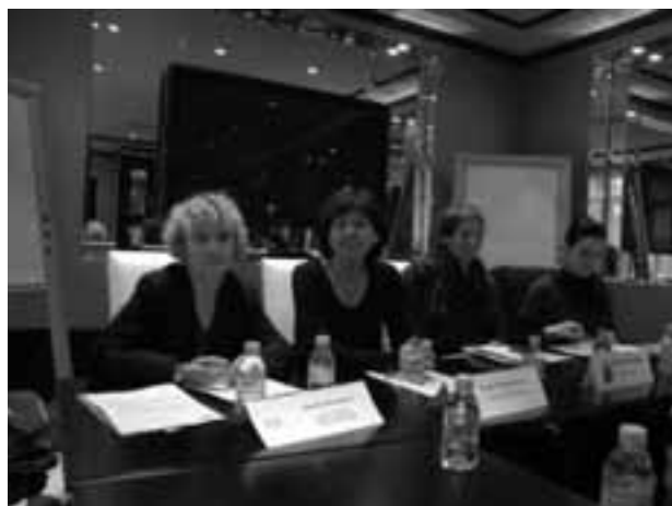
Халқаро ташкилот вакиллари Парижда бўлиб ўтган матбуот анжуманида.