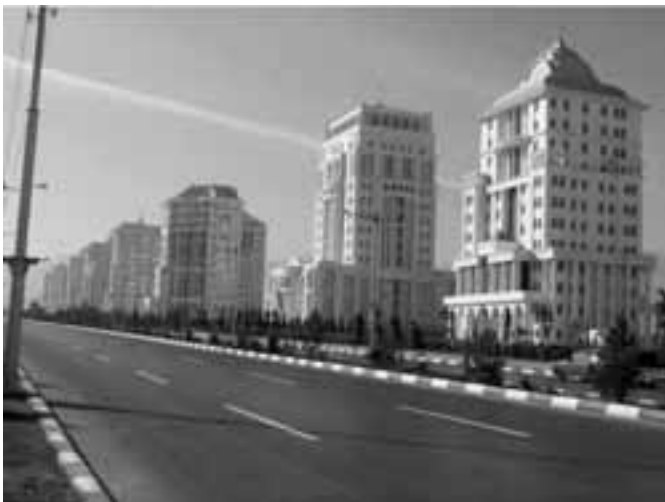
Ашхободдаги янги микрорайон

хусусийлаштириш жараёнини якунига еткази олмайд қолганлар. Ашхободдаги давлат идораси юристи IWPR билан суҳбат чоғида мулкка оид ҳужжатлар амалдорлар томонидан диққат билан ўрганилишини тасдиқлади.