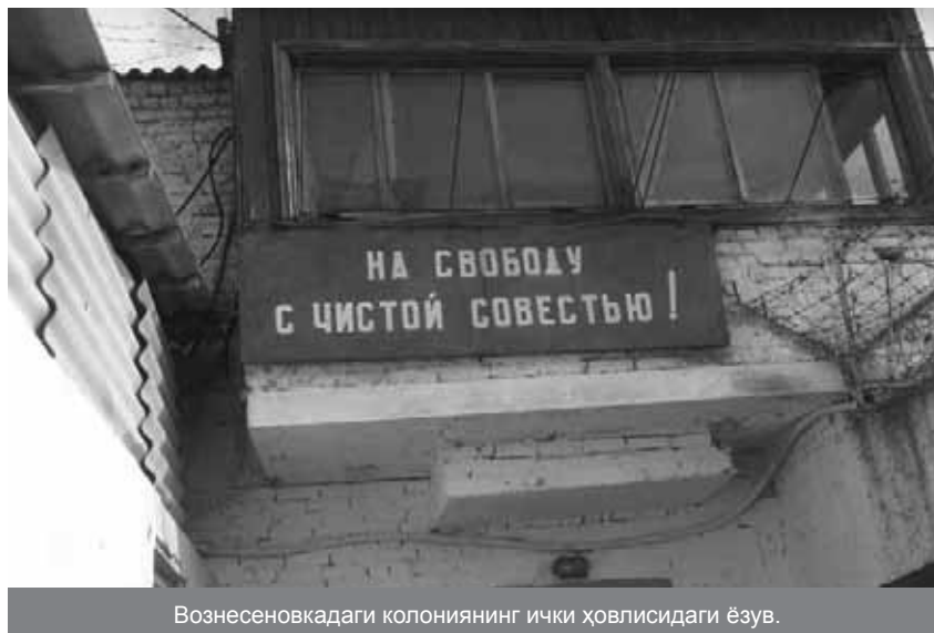
Вознесеновкадаги колониянинг ички ҳовлисидаги ёзув.