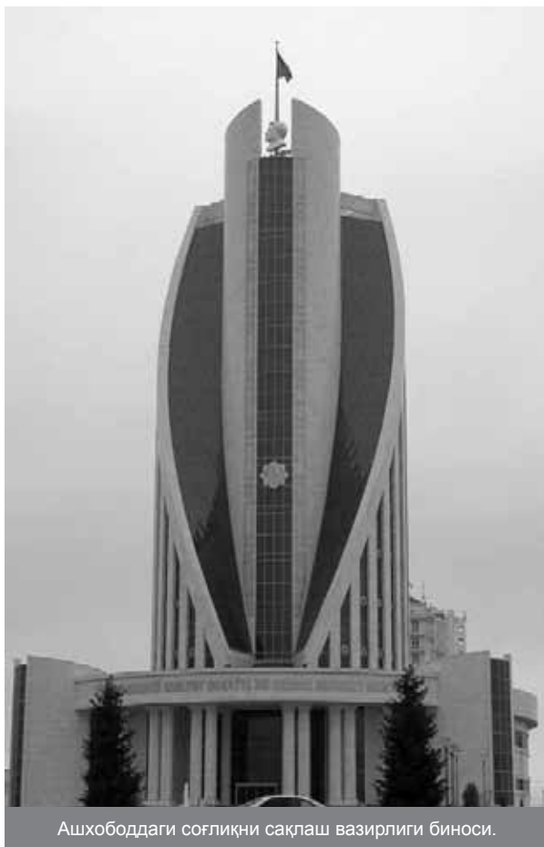
Ашхободаги соғлиқни сақлаш вазирлиги биноси.