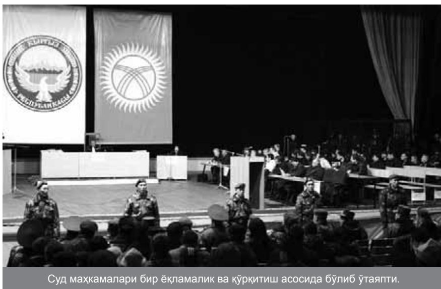
Суд маҳкамалари бир ёқламалик ва қўрқитиш асосида бўлиб ўтаяпти.

Бу каби қудратли хизмат вакилларини судлашда доим хавф-хатар мавжуд бўлади, лекин бунда адолатли судловни амалга оширмаслик ҳам ҳуқуқ-тартибот хизматларининг айрим вакилларида ётсираш кайфиятини пайдо қилади.