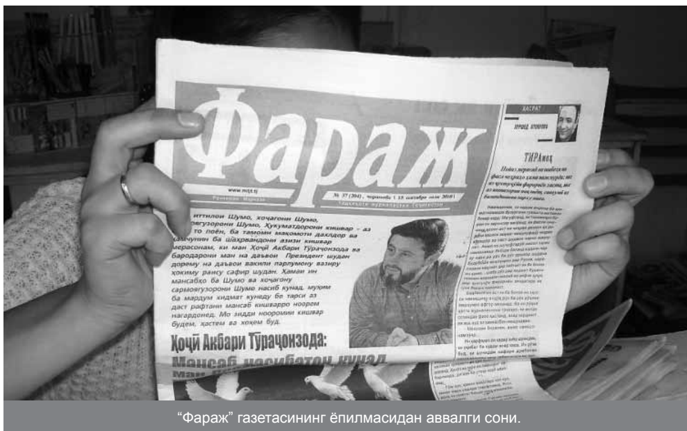
“Фараж” газетасининг ёпилмасидан аввалги сони.