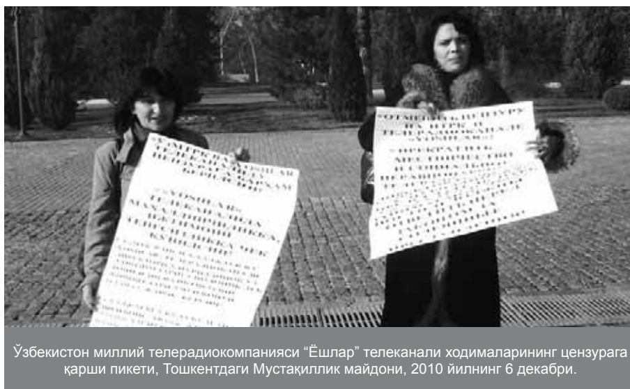
Ўзбекистон миллий телерадиокомпанияси “Ёшлар” телеканали ходималарининг цензурага қарши пикети, Тошкентдаги Мустақиллик майдони, 2010 йилнинг 6 декабри.