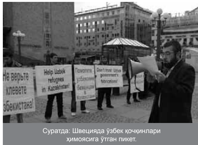
Суратда: Швецияда ўзбек қочқинлари ҳимоясига ўтган пикет.

Қозоғистон қонуни бундай шахсларнинг экстрадиция ёки депортация қилинишини таъқиқлайди. Аммо қонунда бошпана истаб мурожаат қилган кишиларга, улар қандайдир “таъқиқланган ташкилот”га аъзоликда айбланган тақдирда бу кишиларга рад жавоби берилиши айтилгани билан мажбур ташкилот бошқа мамлакатда бўлгани каби Қозоғистонда ҳам таъқиқланган бўлиши лозимлиги ёки йўқлиги ҳақида ҳеч нарса дейилмаган.