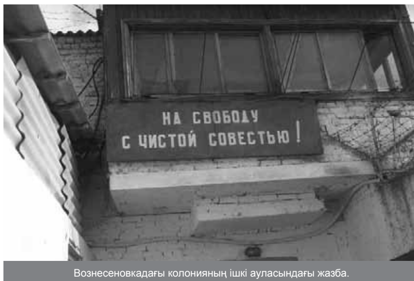
Вознесеновкадағы колонияның ішкі ауласындағы жазба.