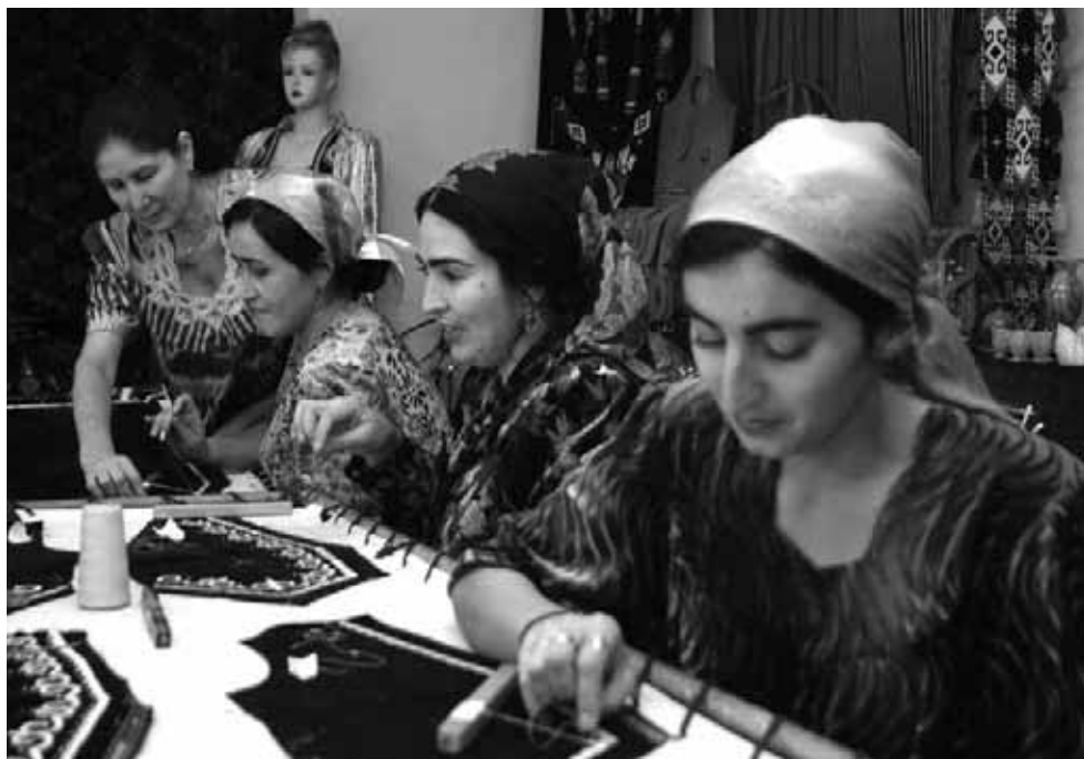
Еңбек мигранттары отбасыларымен байланыстарын үзіп, ақша жіберуді тоқтатқан кезде, олардың жанұяларына жан бағу қиынға соғады.

Жаппай еңбек миграциясына байланысты көптеген тәжікстандықтар қаржылық жағдайын жақсартып жатқан тұста, асыраушысы үйіне ақша жіберуді тоқтатқан отбасылар елдегі кедейлердің қатарына қосылуда.