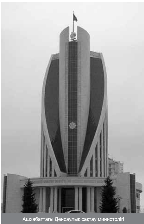
Ашхабаттағы Денсаулық сақтау министрлігі

Оның ойынша, медицина қызметкерлері не болғанда да, өздерінің берген кәсіби анттарын бұзбаулары қажет.