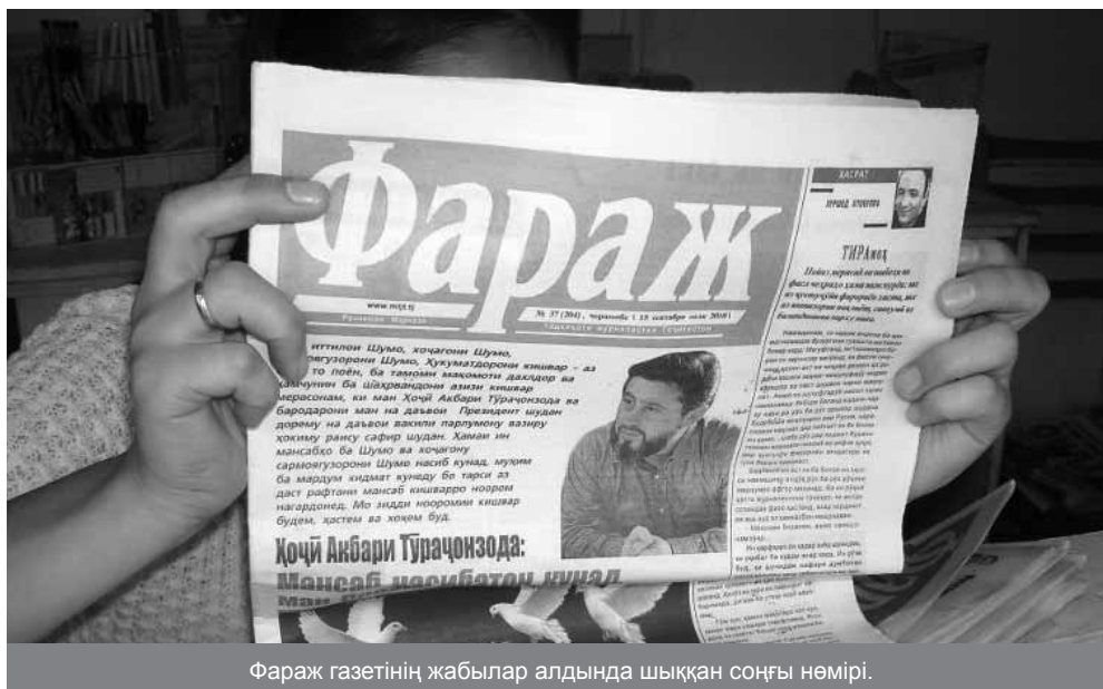
Фараж газетінің жабылар алдында шыққан соңғы нөмірі.