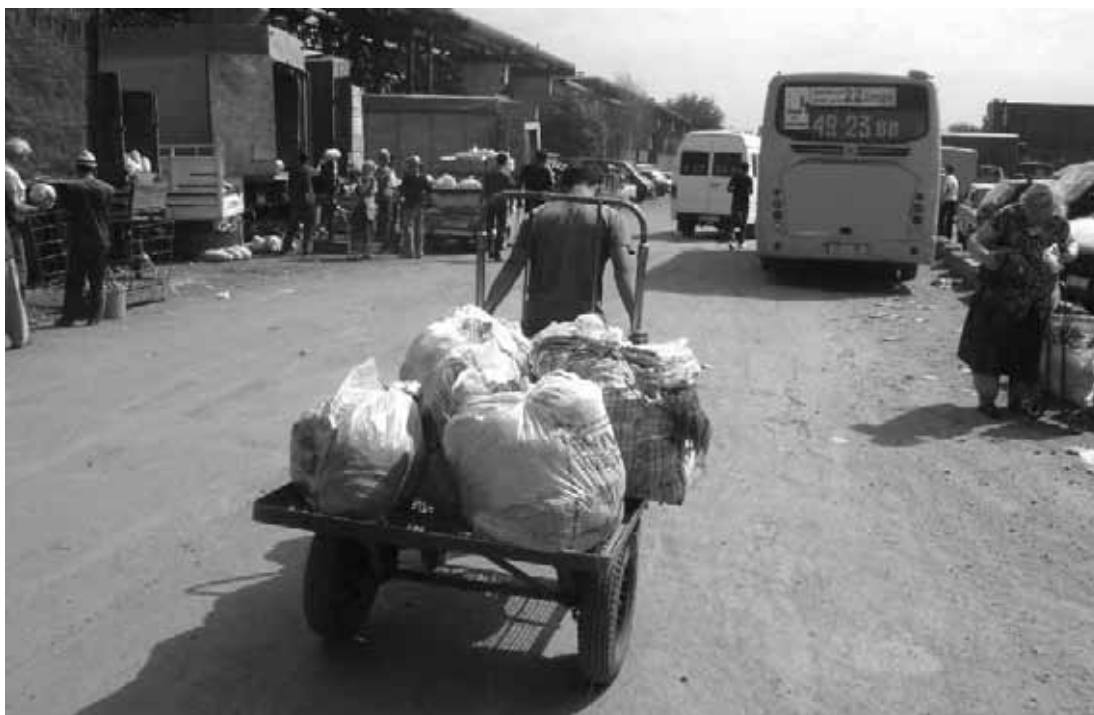
Ауыр өмір балаларды жұмыс үшін мектепті тастауға мәжбүрлеуде

«Жол, жол!» - деп айғайлап, арық келген жасөспірім көкөніс тией салынған арбасымен, Орталық Азияда орналасқан Қырғызстан астанасы Бішкектің фермерлық базарында өзіне жол салып келеді.