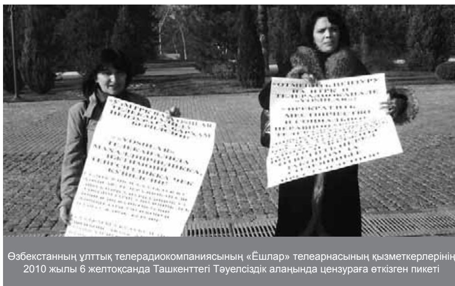
Өзбекстанның ұлттық телерадиокомпаниясының «Ешлар» телеарнасының қызметкерлерінің 2010 жылы 6 желтоқсанда Ташкенттегі Тәуелсіздік алаңында цензураға өткізген пикеті