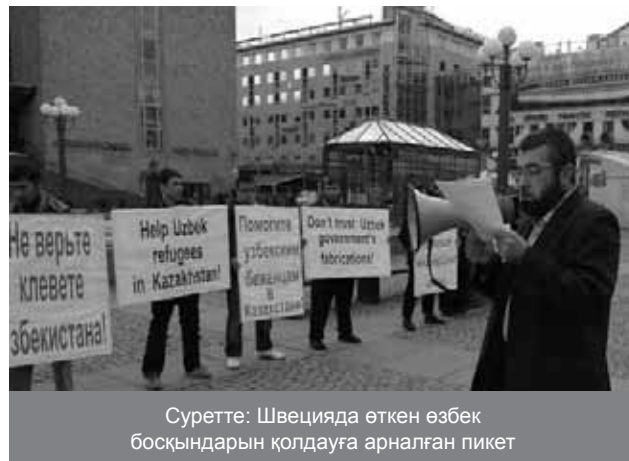
Суретте: Швецияда өткен өзбек босқындарын қолдауға арналған пикет

«Олардың [тыйым салынған] діни ұйымға мүше болуы қолдан жасалған немесе дәлелденбеген болуы