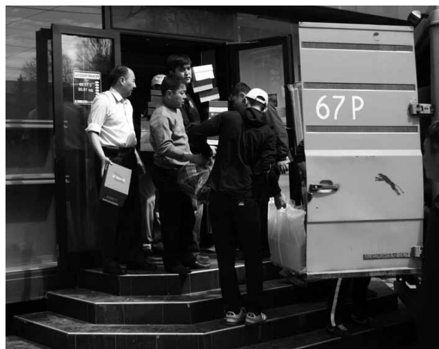
8 апрел. Дўкон эгалари босқинчилардан хавфсизраб, молларни дўкондан олиб чиқишмоқда.