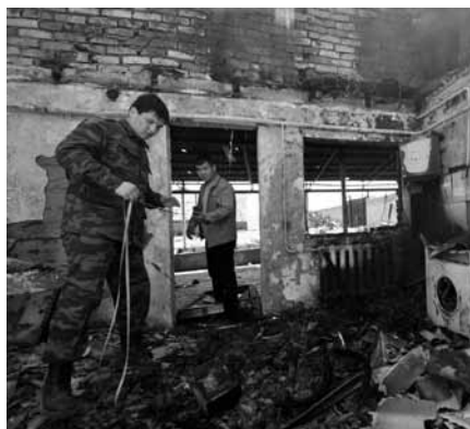
8-апрелдеги сүрөткө далил

Жер бөлүп берүү талабы зомбулук адатка айлана баштаганда өлкөнүн жаңы өкмөтү тартипти камсыз кылууга чакырууда.