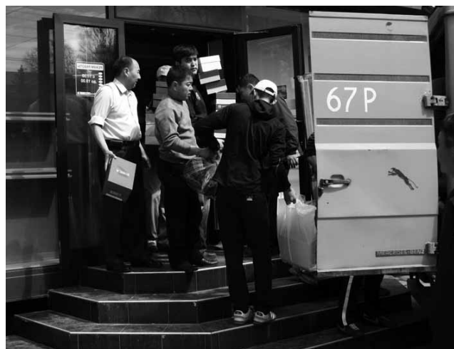
8 сәуір. Дүкендер басып алушылардан сақтанып, тауарларын әкеткелі жатыр