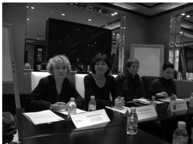
Представители международных организаций на пресс-конференции в Париже.