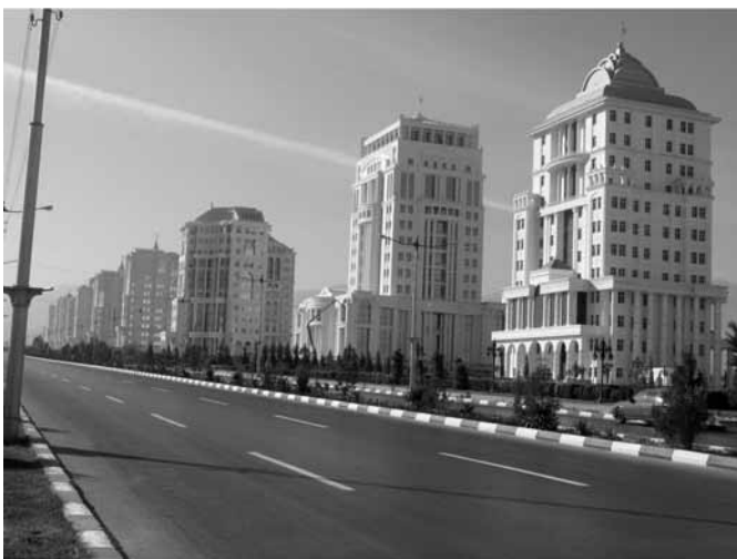
Новый микрорайон в Ашгабаде

когда после развала Советского Союза проходил процесс приватизации. У некоторых имеется законное право собственности, но они не смогли завершить процесс приватизации.