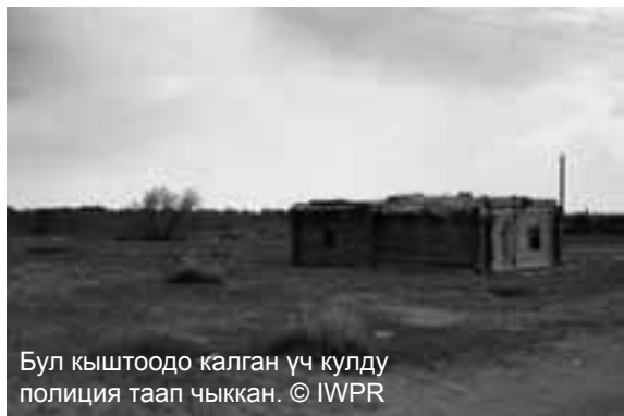
Бул кыштоодо калган үч кулду полиция таап чыккан.

Казакстандын чыгышында адамдарды уурдап, алыскы фермаларга кул катары зордоп иштетүү учурлары катталганын полиция жана укук коргоочу топтор билдирди.