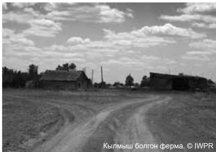
Кылмыш болгон ферма.

Кулчулукка кабыл болгон же дал ошондой көйгөйлөрү бар адамдар үчүн ЭММ кулчулукка сатылган курмандыктар үчүн эки жай ачып, адамдар менен соода кылуу фактыларын